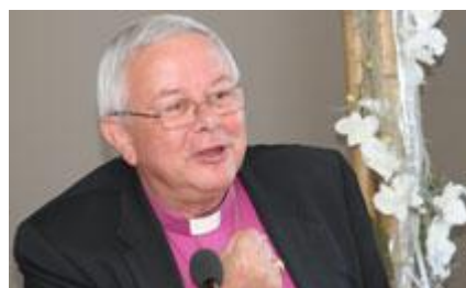
Évêque luthérien Christian Krause

La déclaration est le fruit de discussions entre luthériens et catholiques commencées en 1967, qui ont été jalonnées par de nombreux documents dont Les anathèmes du XVIe siècle sont-ils encore actuels ? (1986).